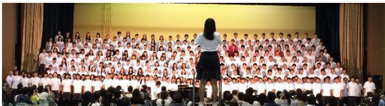
全校合唱「君とみた海」