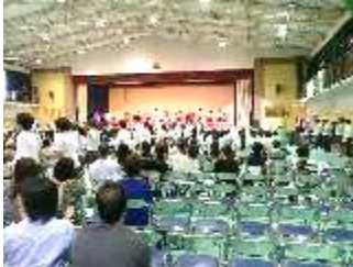
3年「SANTAROU〜70期生みんなが英雄〜」