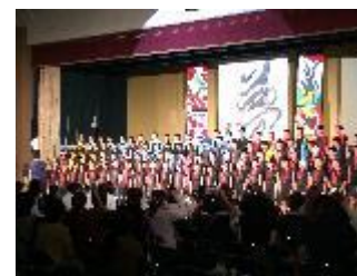
2年「和風総本家〜和になっておどろう〜」