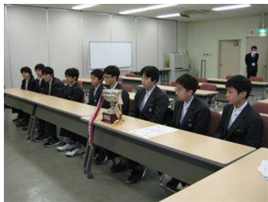
卓球部 島本町長表敬訪問