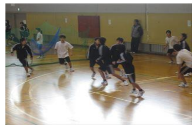
2年球技大会「バレーボール」「ドッチ」