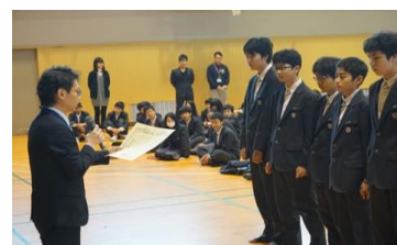
【卓球部教育委員会表彰】