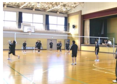
1年球技大会「バレーボール」「ダイヤモンドドッチ」