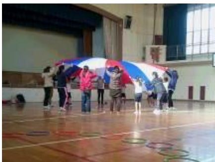
支援教育における授業研究

各小中学校と各保育所幼稚園の支援教育を推進する担当者が連携し、支援教育の研究や交流を進めています。支援を必要とする子どもたちが、保幼小中で一貫したよりよい支援教育を受けられることを目標とし、発達に関する研修、支援教育における授業研究、情報交流、就学前から中学校卒業後まで福祉との連携を目指した研修などを行っています。また、各校園所では支援教育に関する相談窓口があり、随時相談できます。