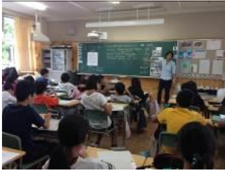
人権教育授業研究

人権教育に関わる授業を、校種をこえて相互に参観しあったり、学習内容や教材、カリキュラムの交流を行ったりしています。また、教職員の人権感覚を高め、すべての子どもたちが互いを認め合い、大切にされる学校・教室をめざして、さまざまな研修を行っています。