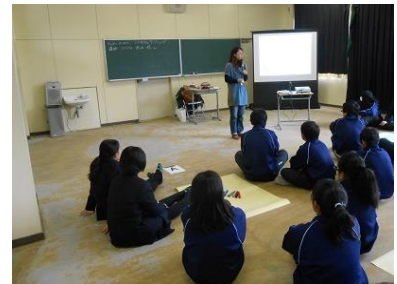
いじめ防止ワークショップ

また、近年、携帯電話やスマートフォンの所持率が増加傾向にあり、そのトラブルの予防について研修会を開催するなど、教職員の意識向上にも努めています。