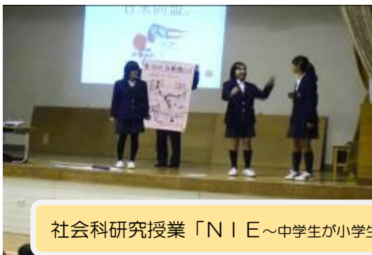
社会科研究授業「NIE～中学生が小学生の社会的疑問に答えよう～」（第二小学校にて）