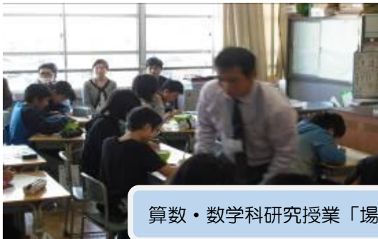
算数・数学科研究授業「場合の数」（第四小学校にて）

町内全教職員参加の授業研究会。町教育研究会教科部会からの提案授業をもとに、効果的な指導や教育内容、教科内の小中のつながり等について協議を行いました。