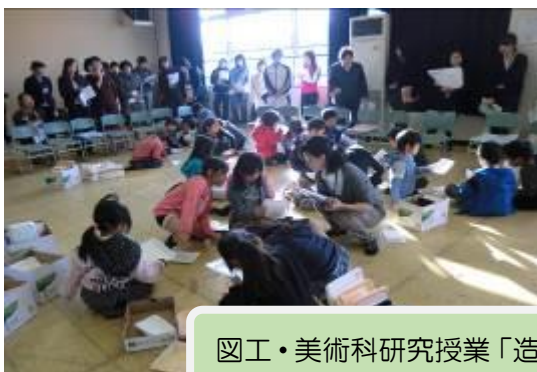
図工・美術科研究授業「造形あそび」（第一小学校にて）