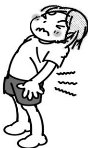
腰をまげたり、 反らしたりすると 痛みがある