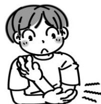
肩やひじの関節に痛みや 動きの悪いところがある