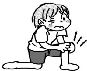
ひざの関節に痛みや 動きの悪いところがある