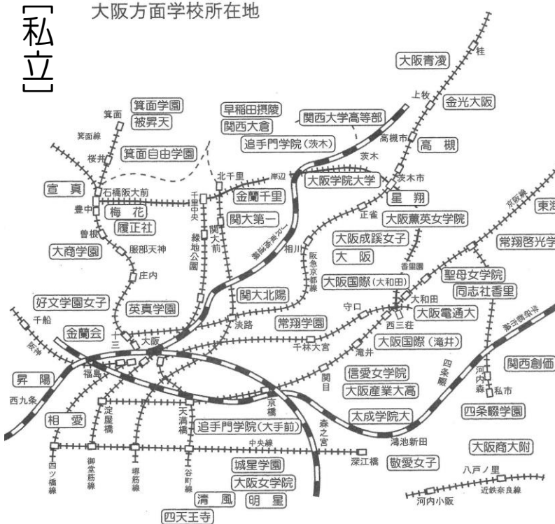
大阪方面学校所在地